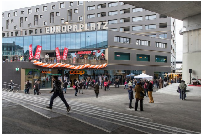
Am Mittwoch wurden im Haus der Religionen in Bern 160 Diplomaten herumgeführt (Archivbild).

Bern 160 Mitglieder des diplomatischen Corps und der Eidgenössischen Räte haben am Mittwoch das Haus der Religionen besucht.