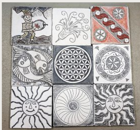
Eine Auswahl der Sgraffito-Werke, die im Kurs von Josin Neuhäusler entstanden sind.

Das Pentagramm schützt vor Unholden, Hexen und dämonischen Mächten, steht aber auch für kosmische Harmonie, Gesundheit, Erkenntnis.