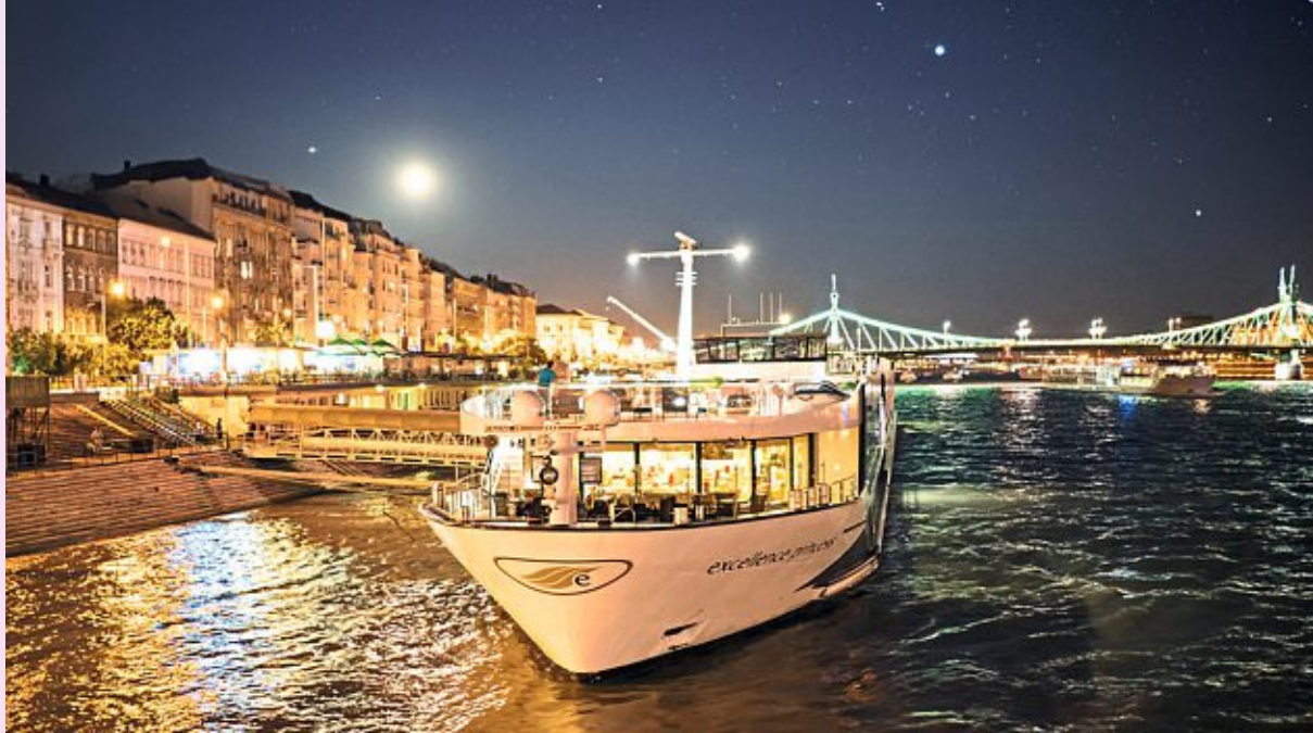
Excellence Princess auf der Donau in Budapest

Festtage im kleinen Schweizer Grandhotel