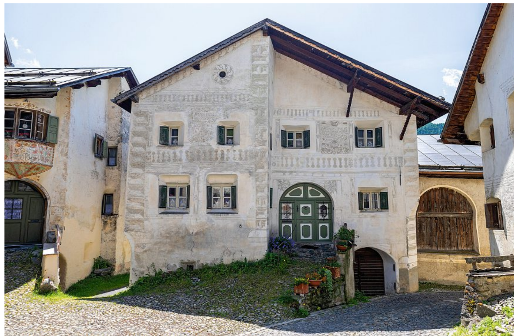
VORBILD Die mit Sgraffiti verzierten Häuser in Guarda inspirierten den Maler Alois Carigiet zu seinen Illustrationen der Geschichten um den Schellen-Ursli.

» Unscheinbare Dörfer wurden durch Sgraffiti zu wahren Perlen.